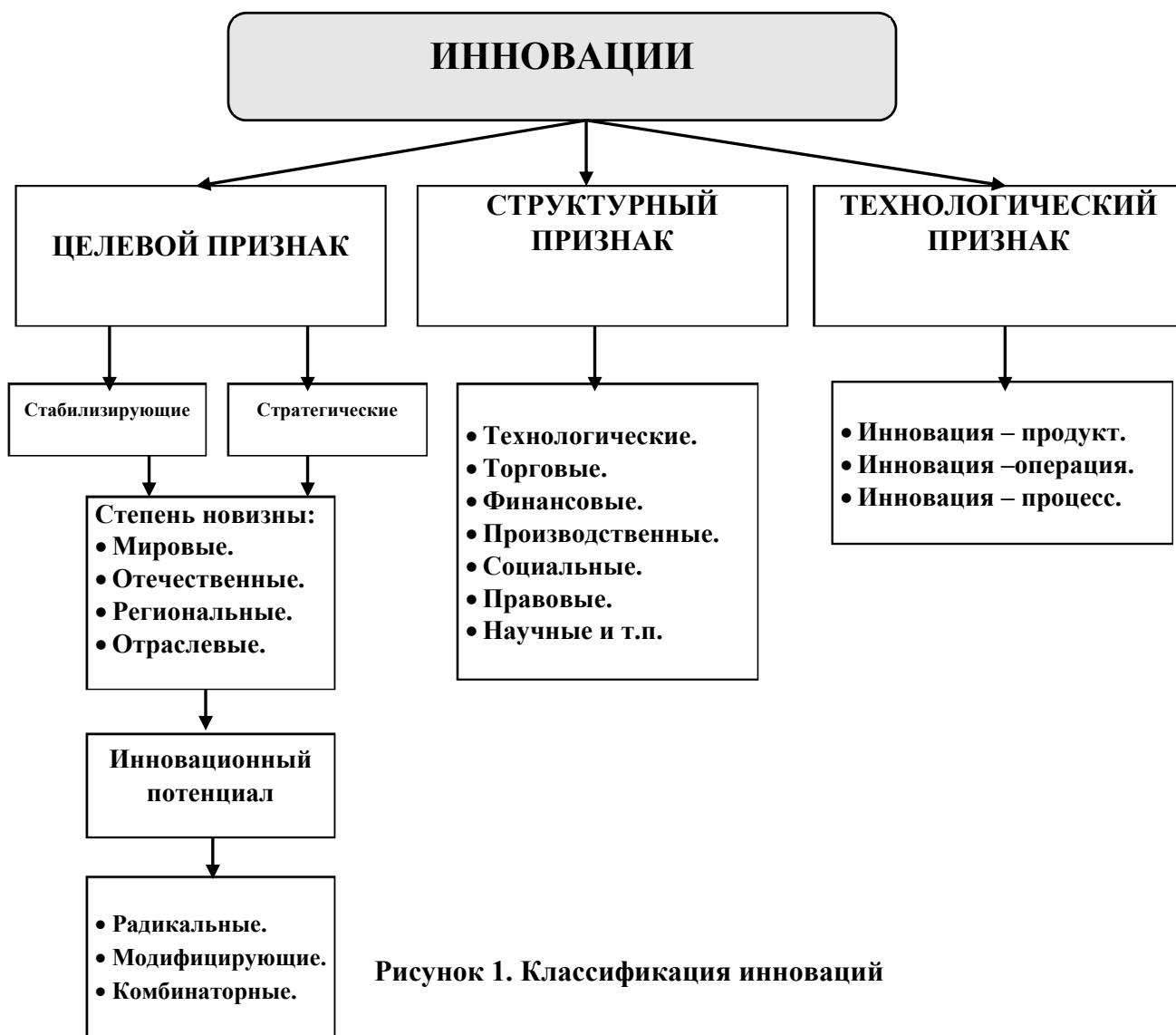
Рисунок 1. Классификация инноваций

Одним из приоритетных направлений применения инструментария экономико-математического моделирования является исследование процессов инновационного развития экономики страны. Важность исследования инновационного развития требует разработки и применения средств моделирования на различных уровнях. Искомые закономерности инновационного развития, которые были выявлены в результате проведения анализа, важно формализовать и отразить в используемых современных экономико-математических моделях. В частности, важным представляется нахождение взаимосвязи между ростом экономики и процессами развития инноваций. Направленность таких исследований заключается в обосновании взаимозависимости развития научно - технической, инновационной деятельности и экономики страны в целом. Исследование российской и отечественной экономической литературы показывает, что также используются различные варианты и трактовки термина «инновации».