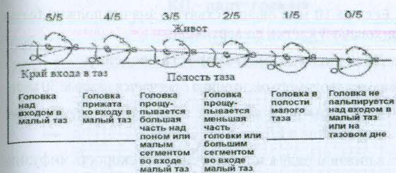
Рис. 1. Расположение головки плода