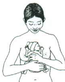
Рис.2. Позиция младенца на матери