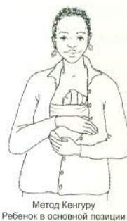
Метод Кенгуру Ребенок в основной позиции