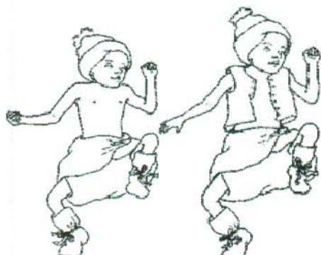
Рис.1. Ребенок, одетый для МК

Обычно, выхаживание преждевременно рожденных новорожденных по методу «кожа-к-коже» длится до нескольких месяцев, пока ребенок сам не покажет, что ему некомфортно в кенгуру-бандаже, и тогда мама может спокойно переносить его в слинг.